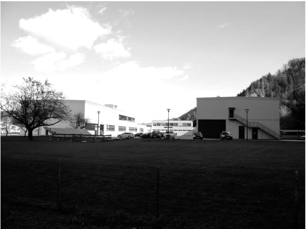
depicted item: Blick von Südwesten in den Hof des Schulkomplexes